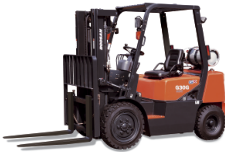
Wózki z napędem gazowym o udźwigu 2000 – 3000 kg G20G / G25G / G30G 2000 kg 2500 kg 3000 kg