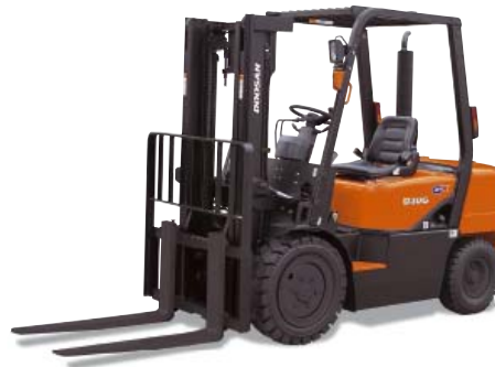
Wózki z napędem Diesla o udźwigu 2000 – 3000 kg D20G / D25G / D30G 2000 kg 2500 kg 3000 kg